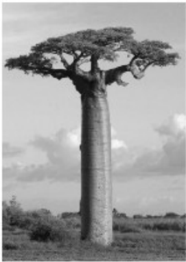
La végétation au Cameroun: le baobab

Mais tsss tss tsss tsss tss Tss tsss tsss tsss tssss Les serpents sont partout.