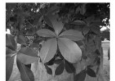
Feuille de baobab

Les fleurs du baobab s'ouvrent vers la fin de journée et tombent le lendemain matin. Elles ont une très mauvaise odeur qui attire les chauves-souris.