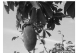
Le fruit du baobab : le pain de singe

Les fleurs de baobab s'ouvrent vers la fin de journée et tombent le lendemain matin. Elles ont une très mauvaise odeur qui attire les chauve-souris.