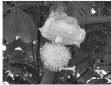
La végétation au Cameroun: le baobab

Les fleurs du baobab s'ouvrent vers la fin de journée et tombent le lendemain matin. Elles ont une très mauvaise odeur qui attire les chauves-souris.